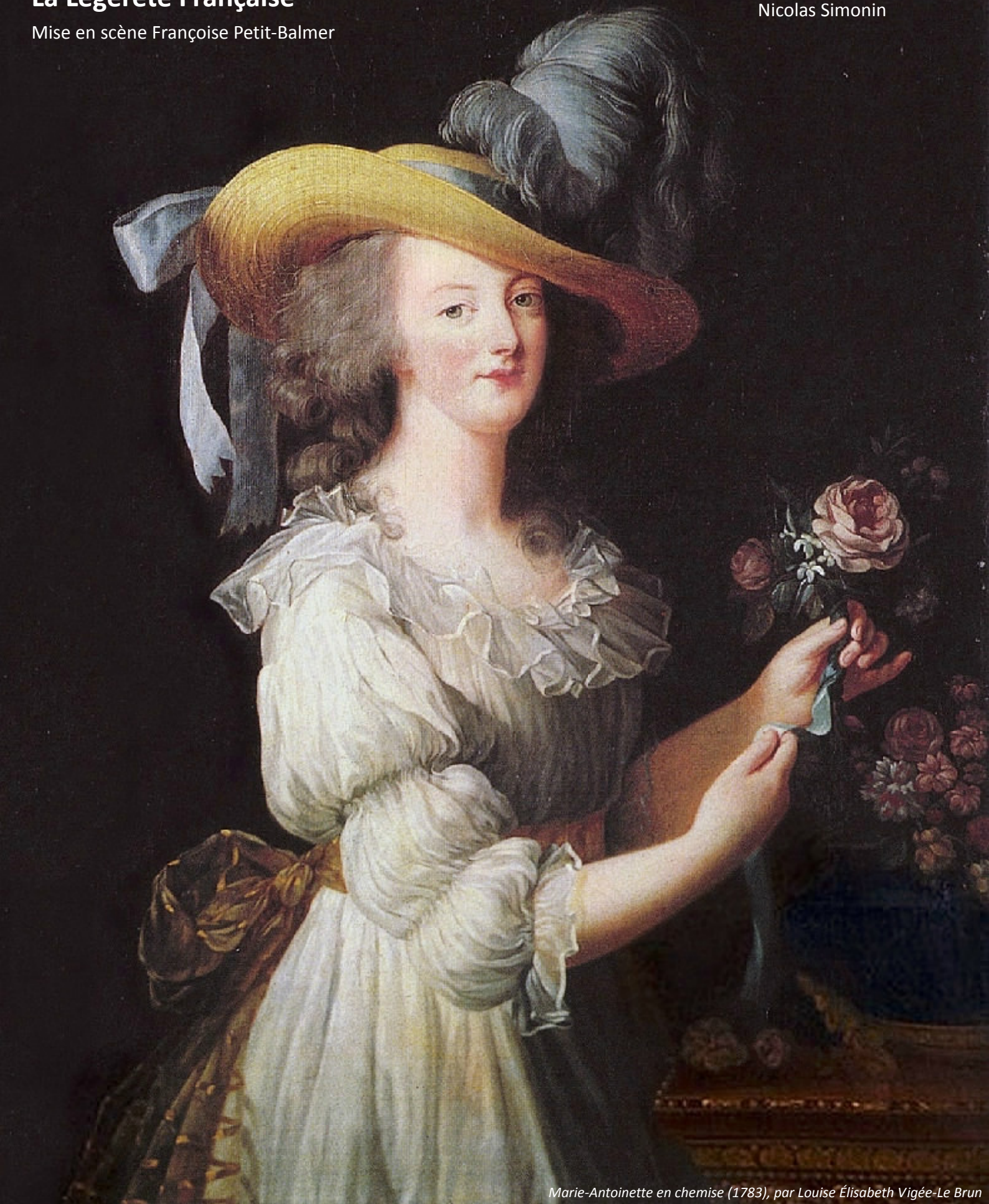
Marie-Antoinette en chemise (1783), par Louise Élisabeth Vigée-Le Brun

Afin de pouvoir au mieux accompagner ce projet délicat et intime, il m'a semblé important d'effectuer une petite recherche pour se nourrir de l'esprit et de l'esthétique afin de pouvoir proposer une démarche scénographique cohérente.