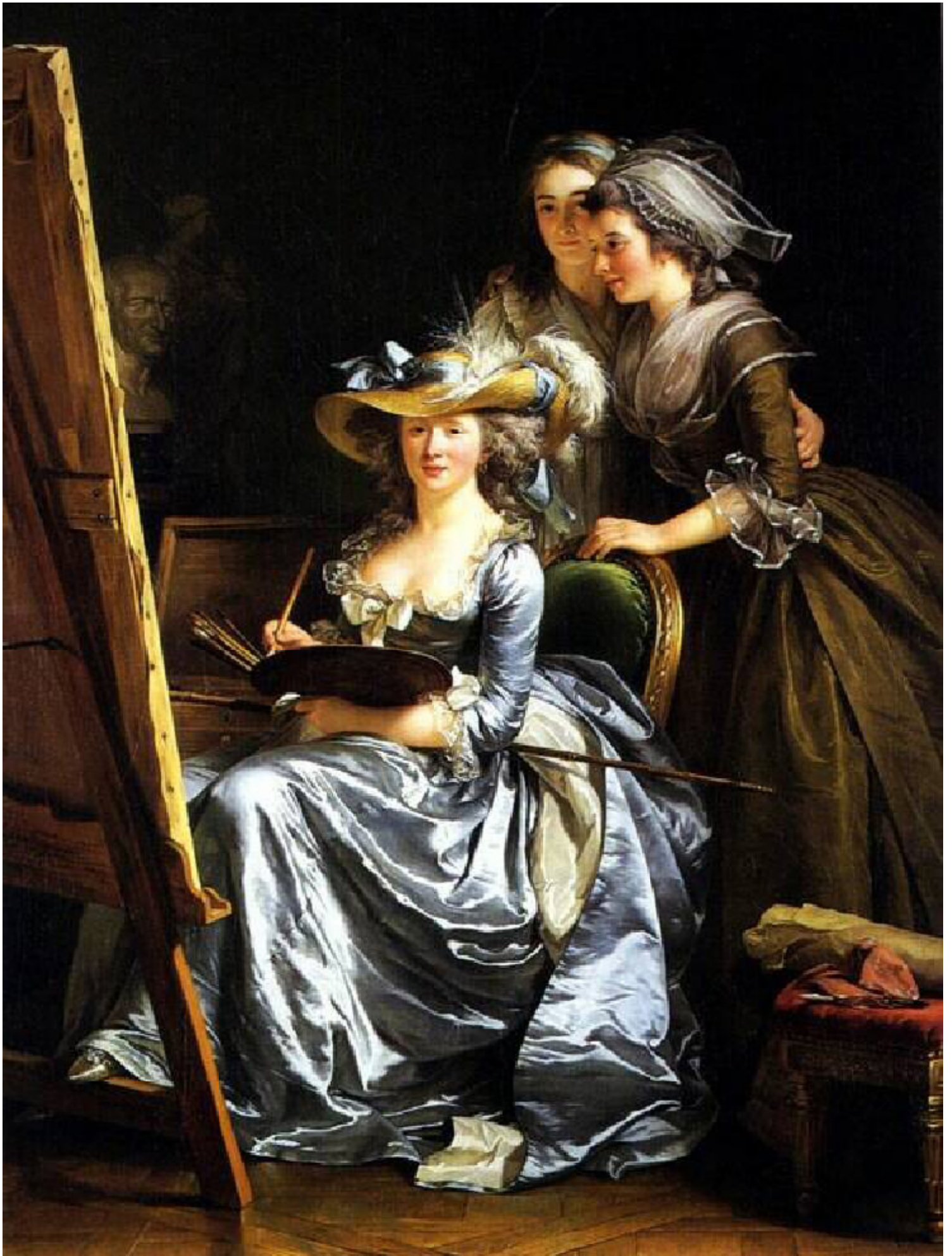
Adélaïde Labille-Guiard - autoportrait (1785)