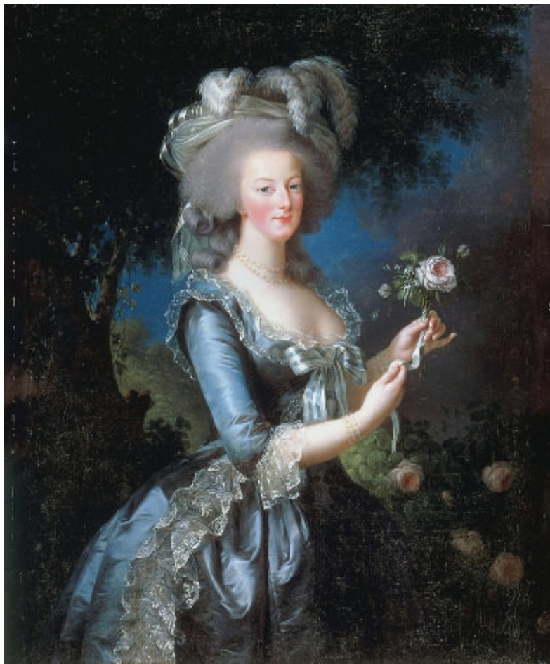
Marie-Antoinette en 1783, par Élisabeth Vigée Le Brun.

Marie-Antoinette Josèphe Jeanne de Habsbourg-Lorraine, archiduchesse d'Autriche, princesse impériale, princesse royale de Hongrie et de Bohême, (née le 2 novembre 1755 à Vienne – morte le 16 octobre 1793 à Paris), fut la dernière reine consort de France et de Navarre (1774–1792), épouse de Louis XVI, roi de France et de Navarre.