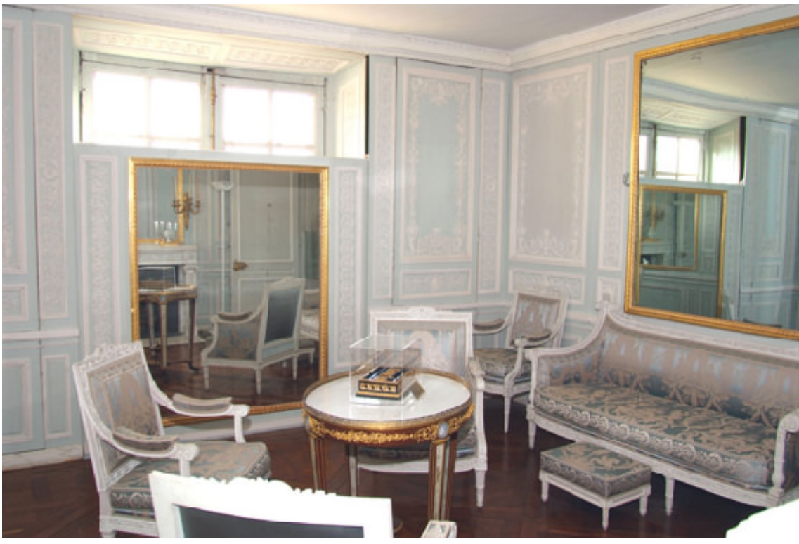
le petit Trianon et la vue depuis le Belvédère