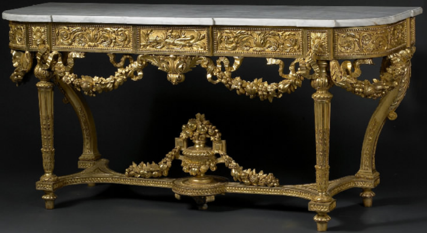
meuble louis XVI